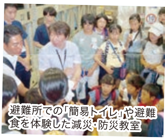
避難所での「簡易トイレ」や避難 食を体験した減災・防災教室