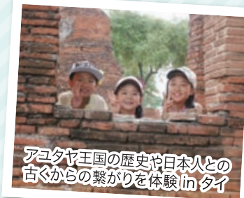
アユタヤ王国の歴史や日本人との 古くからの繋がりを体験 in タイ