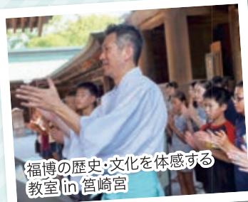
福博の歴史・文化を体感する 教室 in 宮崎