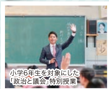
小学6年生を対象にした 「政治と議会」特別授業