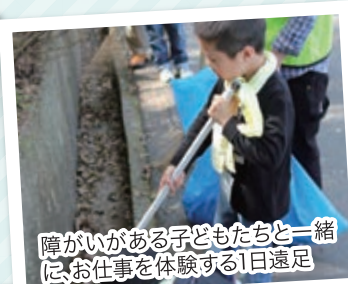
障がいがある子どもたちと一緒に お仕事を経験する1日遠足