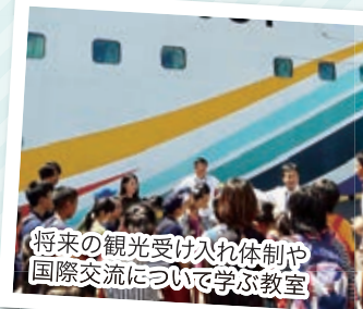
将来の観光受け入れ体制や 国際交流について学ぶ教室