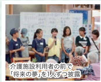
介護施設利用者 앞에서 「将来の夢」を1人ずつ披露