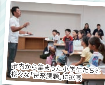
市内から集まった小学生たちと 様々な「将来課題」に挑戦