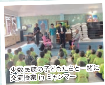
少数民族の子どもたちと一緒に 交流授業 in ミャンマー