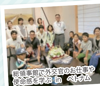
総領事館で外交官のお仕事や 使命感を学ぶ in ベトナム