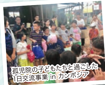
孤児院の子どもたちと過ごした 1日交流事業 in カンボジア