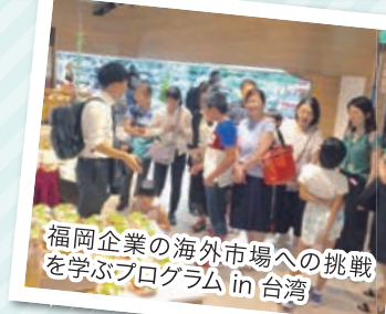
福岡企業の海外市場への挑戦 を学ぶプログラム in 台湾