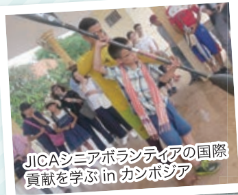
JICAシニアボランティアの国際 貢献を学ぶ in カンボジア