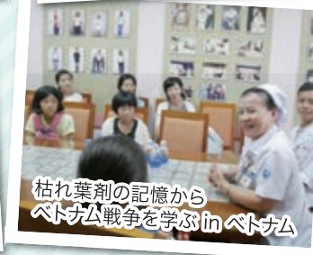
枯れ葉剤の記憶から ベトナム戦争を学ぶ in ベトナム