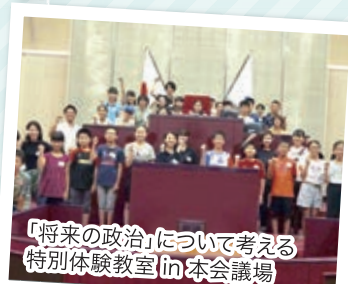
「将来の政治」について考える 特別体験教室 in 本会議場

2018年度の取組みを支えていただいた「福岡の子どもたち応援企業・団体」の皆さま!